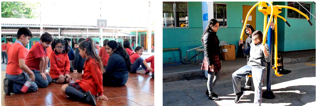
Fotograma 2. Fotogramas del cortometraje Acoso .

Otro cortometraje destacado es Acoso , donde los(as) estudiantes narran el bullying hacia una estudiante que se declara lesbiana. Al respecto, destaca la escena inicial que exhibe a escolares pequeños jugando despreocupados(as), mientras, montado en paralelo, la protagonista enfrenta y soporta el acoso de sus compañeros(as) en los pasillos y baños de la escuela. Una importante secuencia previa a la acción central es el diálogo entre los(as) acosadores(as), escenificada en los juegos de la escuela, que reafirma cómo los(as) autores(as) del film supieron representar dramáticamente su historia; fueron capaces de utilizar diferentes recursos narrativos y audiovisuales, tales como la elipsis o el flashback , además del uso de distintos planos y movimientos de cámara, para acentuar momentos dramáticos. El fotograma 2 muestra escenas de la producción.