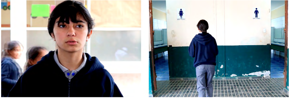
Fotograma 1. Fotograma de la secuencia final de Pantalón gris