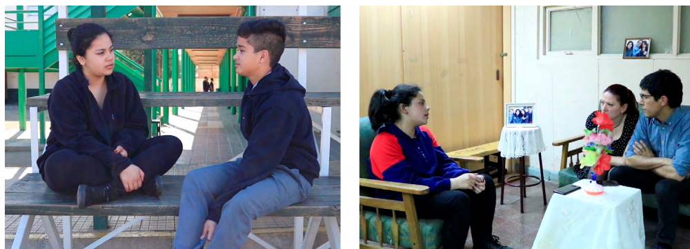
Fotograma 3. Fotogramas del cortometraje Es mi decisión.

pueden estar ocurriendo delante de la mirada docente e, incluso, familiar, pero que permanecen ocultas. El