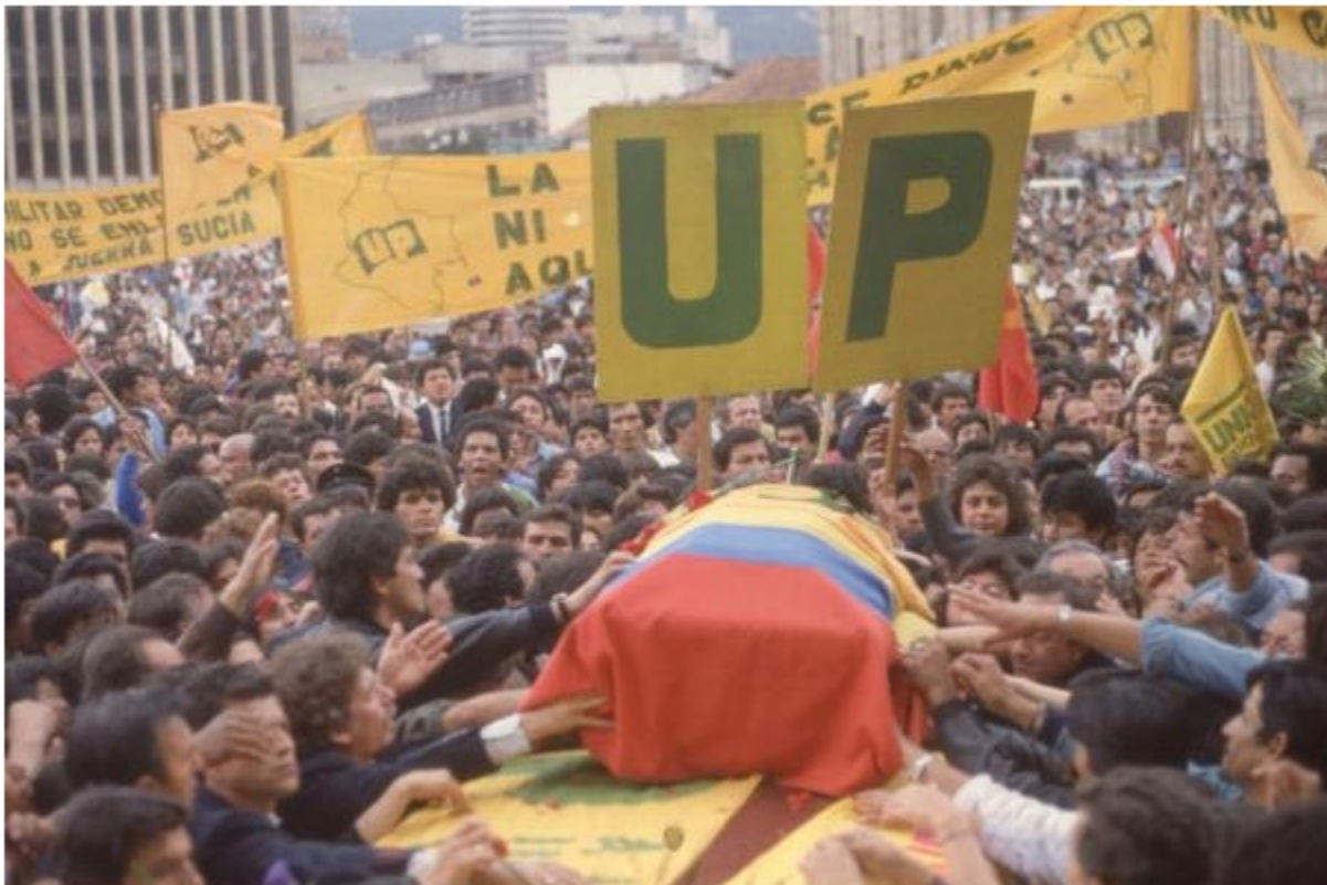
Manifestación tras la muerte de Jaime Pardo Leal.