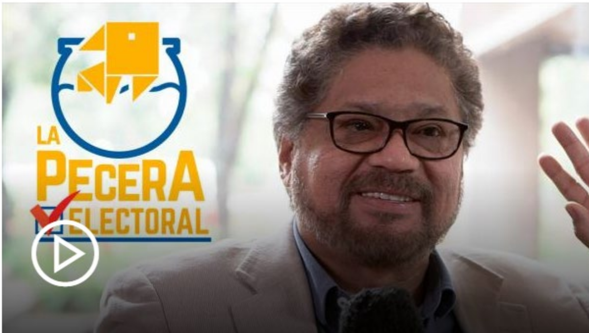
'Iván Márquez en 'La Pecera Electoral' de EL TIEMPO.