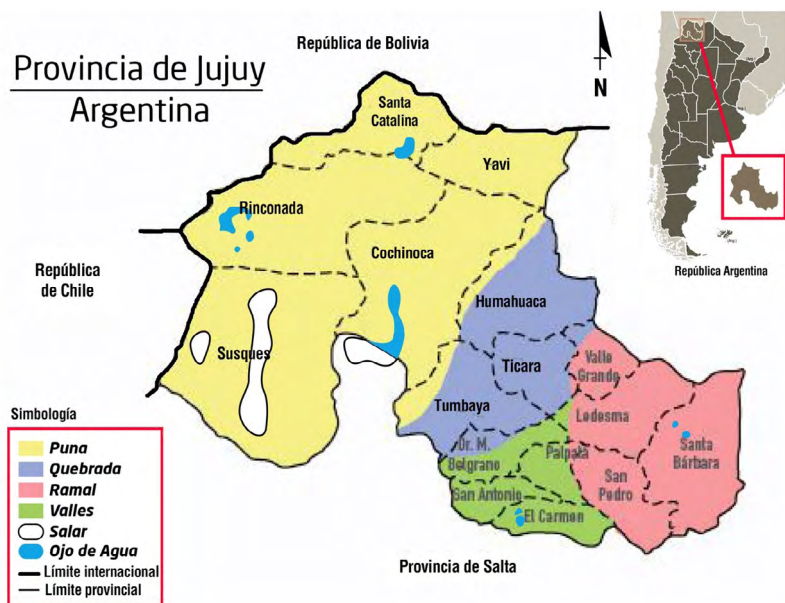
Mapa 1. Regiones de la Provincia de Jujuy y posición relativa en la República Argentina.