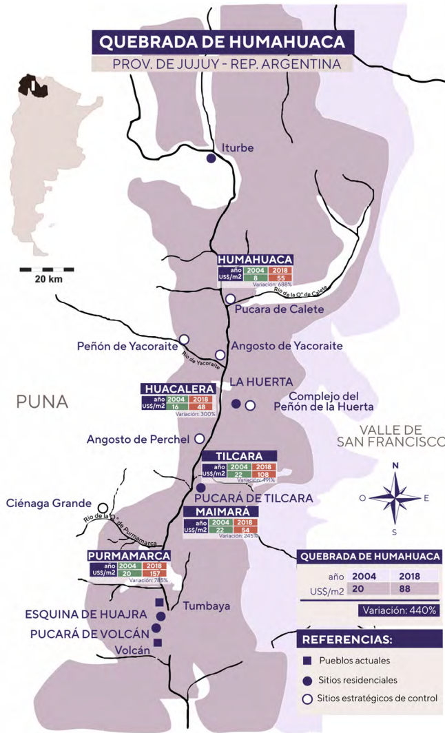
Mapa 4. Precios de la tierra por metro cuadrado en dólares. Quebrada de Humahuaca. Años 2004-2018.