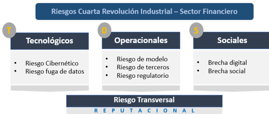
Figura 3. Los riesgos TOS de la Industria 4.0 en el sector financiero

Para la presentación de los riesgos se propone el esquema TOS, el cual metodológicamente se ilustra en la figura 3.