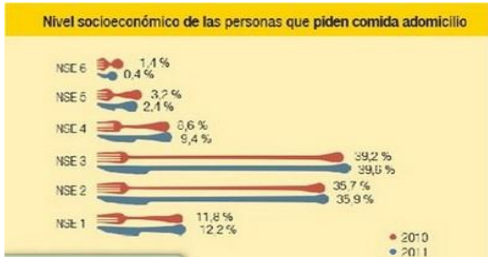
Figura 3