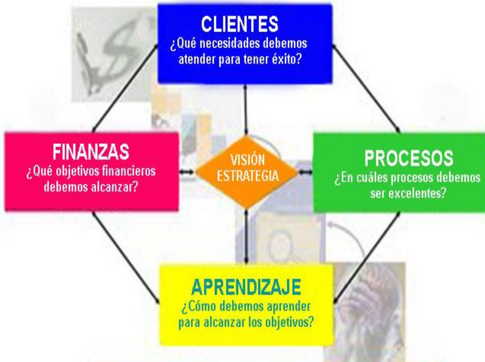
Figura 2. Las 4 perspectivas del Balanced Scorecard

En la Figura 2 vemos las 4 perspectivas del Balanced Scorecard