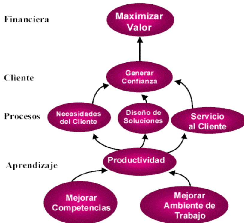
Figura 3. Modelo causa-efecto

El poder del BSC aparece cuando se transforma de un sistema de indicadores en un sistema de gestión estratégica: Es posible unir en un solo informe de gestión