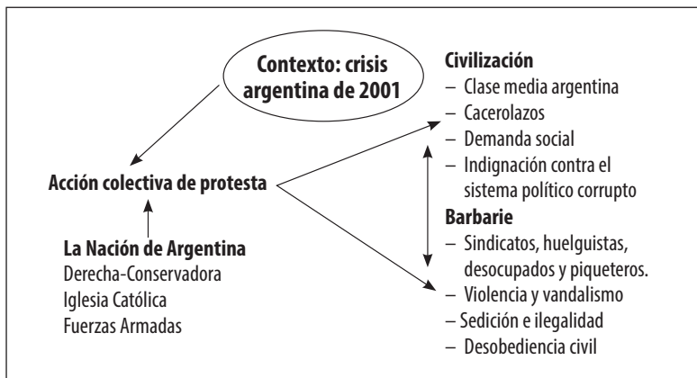
Figura 1. Estructura del imaginario de la protesta social en el discurso editorial del diario La Nación (Argentina)

Sobre la base de los resultados obtenidos a partir del análisis del corpus declarado en nuestra investigación, podemos determinar que el diario La Nación construye un imaginario social de la acción colectiva de protesta a partir de dos elementos nucleares presentes en todo el discurso editorial articulado a propósito de los eventos enmarcados en la crisis argentina de 2001, a saber: civilización y barbarie.