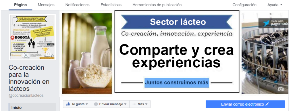
Figura 3. Página Web Co-creación para la innovación en lácteos

Durante el proceso se invitó a empresas del sector, consumidores y demás actores a seguir la página de Facebook donde se publicó información de la industria y de la investigación periódicamente.