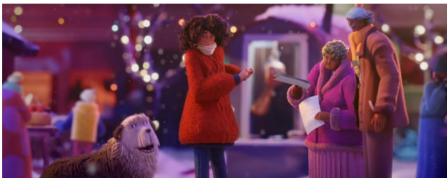
Figuras 3, 4 e 5. Cenas do comercial da campanha natalina da Apple Share your gifts (2018)