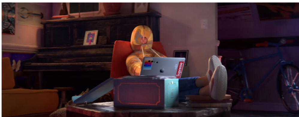
Figuras 1 e 2. Cenas do comercial da campanha natalina da Apple Share your gifts (2018)