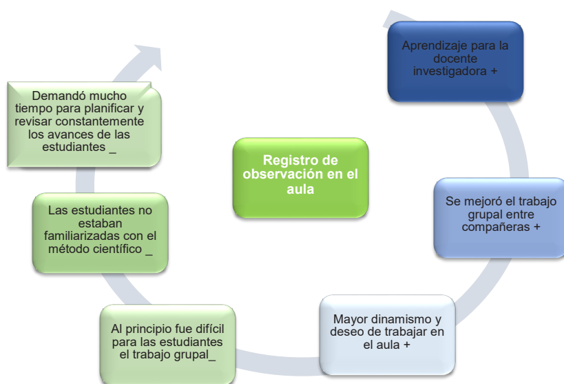
Figura 3. Registro de observación en el aula

En la figura 3 se describen los aspectos considerados positivos y negativos presentados durante la intervención, siendo estos últimos identificados como algunos limitantes en la investigación.