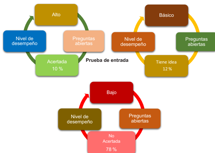
Figura 2. Nivel de desempeño relacionado con preguntas abiertas “prueba de entrada”

En esta etapa el 78 % de las estudiantes no saben la respuesta de preguntas directamente relacionadas con el tema objeto de estudio. Lo anterior puede comprenderse, teniendo en cuenta que el tema es nuevo para ellas y las nociones que puedan presentarse no están estructuradas sobre conceptos sólidos adquiridos en el aula de clase.