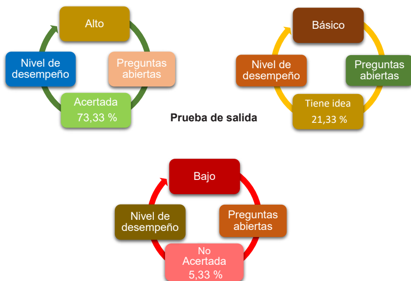
Figura 4. Nivel de desempeño relacionado con preguntas abiertas “prueba de salida”

Como se aprecia en la figura 5, al comparar los resultados obtenidos en la etapa de entrada con la etapa de salida, se puede ver como el nivel de desempeño alto, registrado en la etapa inicial, fue de 10 % y pasó en la etapa de salida a 73,33 %. Este resultado lleva a entender que el 73,33 % de las estudiantes logran comprender que todos podemos hacer ciencia, se apoyaron de manera apropiada en el método científico para explicar eventos o fenómenos que llamaron su atención y participaron en la clase mostrando dinamismo y respeto por las opiniones de sus compañeras.