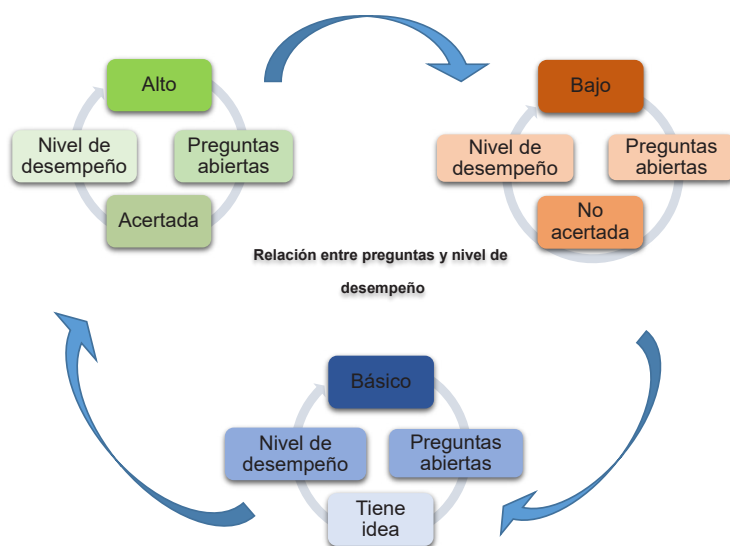
Figura 1. Relación entre preguntas y nivel de desempeño Fuente: elaboración propia.

Para manejar la información cuantitativamente, se asignan unas categorías a las respuestas obtenidas en las encuestas y se establece relación entre estas categorías y los criterios de evaluación adoptados en la Institución Educativa que son: desempeño bajo (1 a 2,9), básico (3,0 a 3,9), alto (4,0 a 4,6) y desempeño superior (4,7 a 5,0). Esta información se precisa en la figura 1.