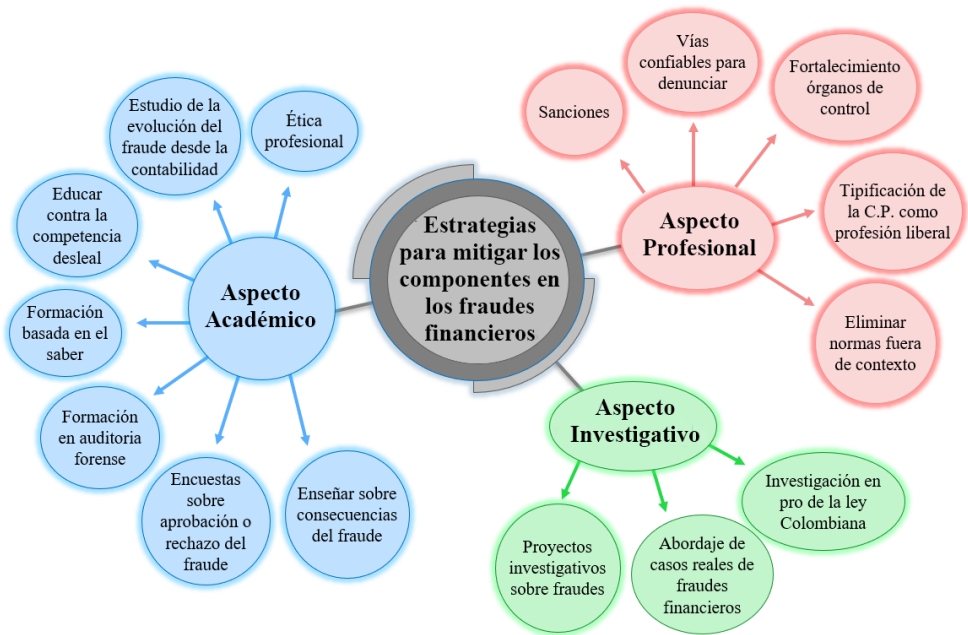
Figura 2. Estrategias para mitigar la presencia de componentes en fraudes financieros