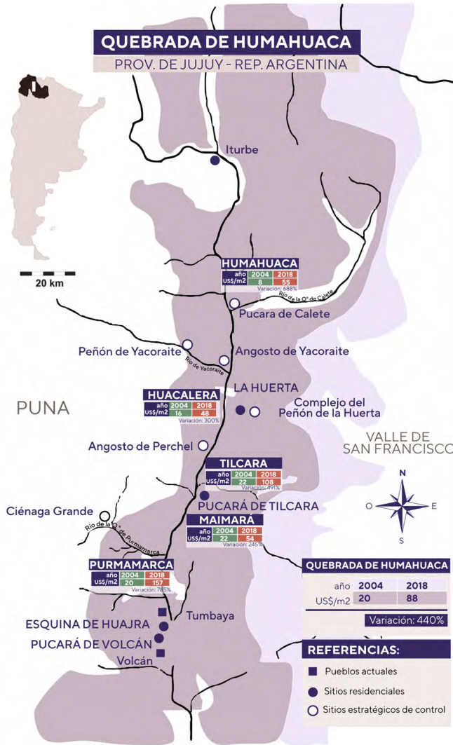
Mapa 4. Precios de la tierra por metro cuadrado en dólares. Quebrada de Humahuaca. Años 2004-2018.