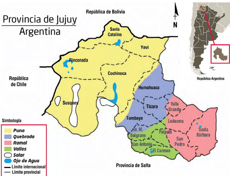
Mapa 1. Regiones de la Provincia de Jujuy y posición relativa en la República Argentina.