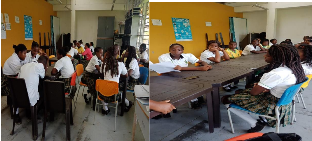
Fotografía 1. Grupos de discusión