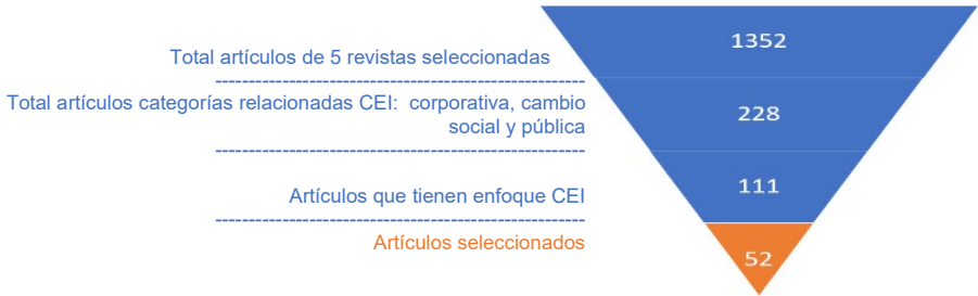
Gráfico 1. Proceso de reducción de artículos