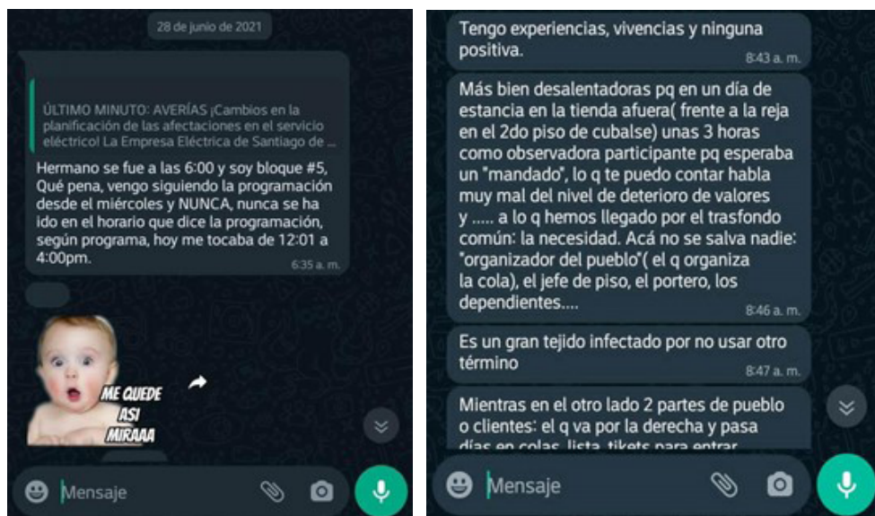
FIGURA 1. Uso del lenguaje informal

El lenguaje utilizado fue mayormente formal (63,5 %), aunque se empleó en ocasiones el matiz informal para dirigirse a otros miembros (36,5 %), con lo cual se cumple la Hipótesis 3. A continuación se muestran ejemplos de diálogos informales: