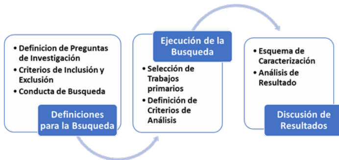
Figura 1. Proceso de un mapeo sistemático

Para poder encontrar artículos relevantes de forma estructurada y repetible se empleó un mapeo sistemático [18-19], el cual proporciona una visión general amplia del estado del arte, lo cual permite observar de forma objetiva el avance y alcance de las investigaciones relacionadas al tema. El proceso para llevar a cabo un estudio de mapeo se describe en las siguientes subsecciones.