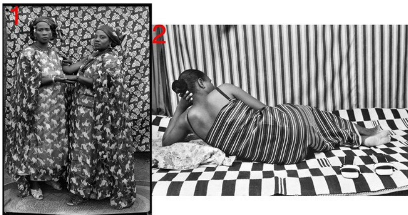
Figura 2 – (1) Seydou Keïta, Bamako (Mali), entre 1948 e 1963. Contemporary African Collection (CAAC) – The Pigozzi Collection. (2) Malick Sidibé, da série "Vista de costas", Bamako (Mali), c. 1990, Coleção Maramotti, Reggio Emilia, Itália.

Fontes: (1) https://ims.com.br/exposicao/seydou-keita-ims-sp/ , acesso em 05/02/2024. (2) https://revistazum.com.br/radar/seydou-keita/ , acesso em 05/02/2024.