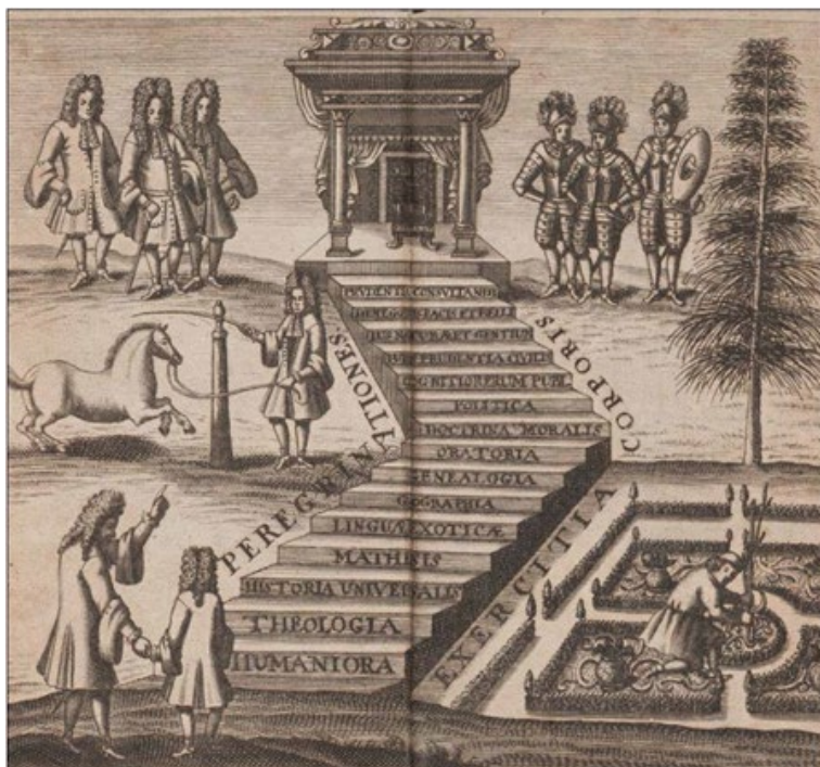
Figura 1 – Gravura de Anton Wilhelm Schwart, para o livro Der adeliche Hofmeister , 1693.