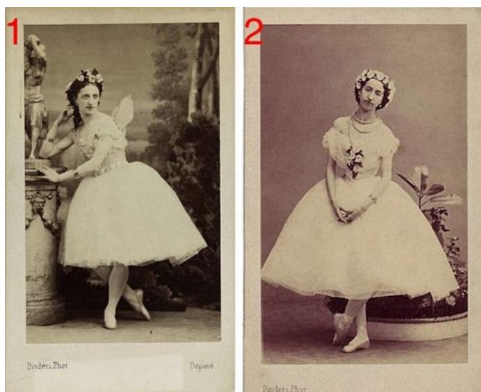
Figura 3 – Exemplos de carte de visite produzidas por André-Adolphe-Eugène Disdéri com acessórios de estúdio. (1) Disdéri, coluna grega no retrato da bailarina Marfa Muravyeva, 1863. (2) Disdéri, jardim de inverno como acessório de estúdio no retrato de Emma Livry, 1861.