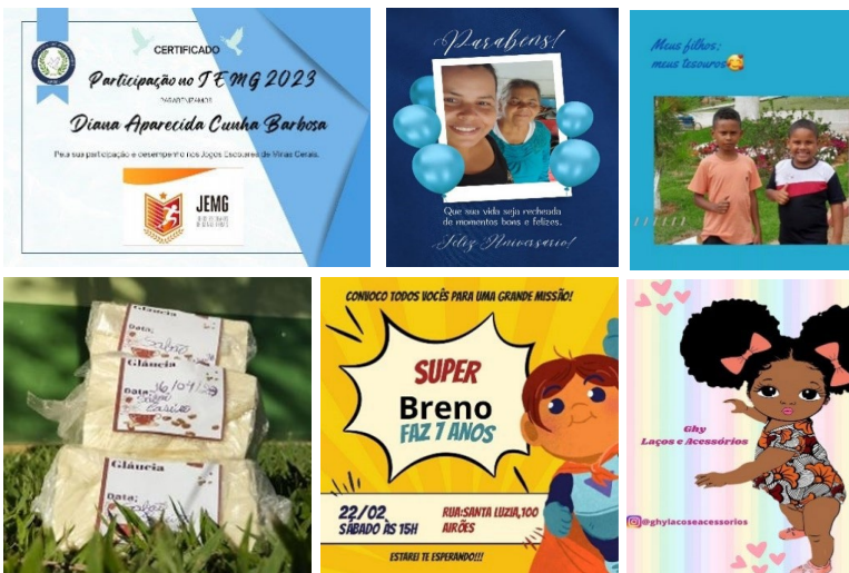
Figura 3. Artes y fotografías

Las mujeres usaron el conocimiento de literacidad digital en su vida cotidiana para anunciar sus productos, como profesoras y en la vida familiar, pero se observaron pocos cambios en la producción de contenido comunitario en la cocm. Sobre el uso del Canva en la rutina escolar, la profesora CM 04, 42 años, mencionó que el aprendizaje en los talleres mejoró la comunicación entre la escuela y las familias. "Las personas que trabajamos en el aula podemos hacer artes, cuando enviamos mensajitos para casa (del alumno), hacemos un arte y no necesitamos explicarlo, la familia lo entiende, ¡es muy bueno!".