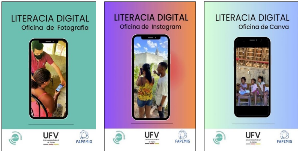
Figura 1. Material didáctico de los talleres

La etapa preparatoria de la investigación involucró encuentros con las líderes comunitarias para planificar las actividades, escuchar las demandas y articular las agendas 7 . Después, desarrollamos el material didáctico para los talleres de Canva, Técnicas de Fotografía e Instagram, con imágenes de personas de la comunidad en un intento de aproximar y valorar a esas mujeres (véase Figura 1).