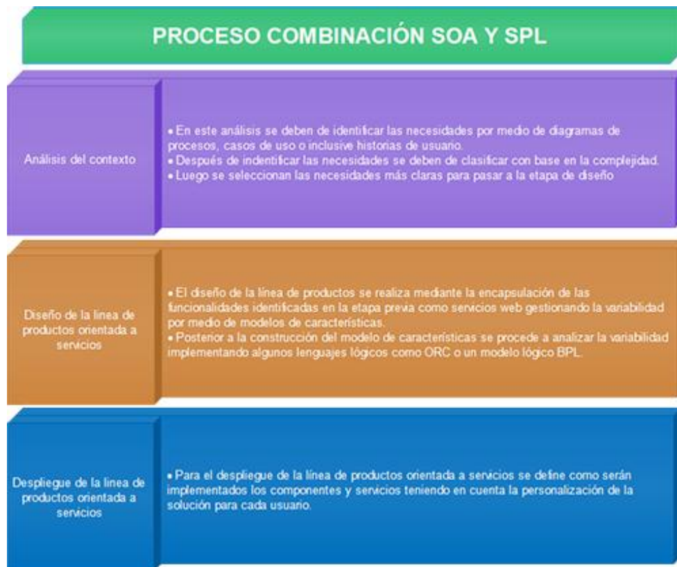
Figura 2. Fases proceso combinación SOA y SPL.

Por medio de este proceso es más intuitivo entender que se debe de realizar para llevar a cabo la combinación de ambas propuestas y para que se están utilizando los diferentes mecanismos técnicos. A continuación se muestran de manera gráfica las etapas que hacen parte de la combinación de las líneas de productos de software y las arquitecturas orientadas a servicios.