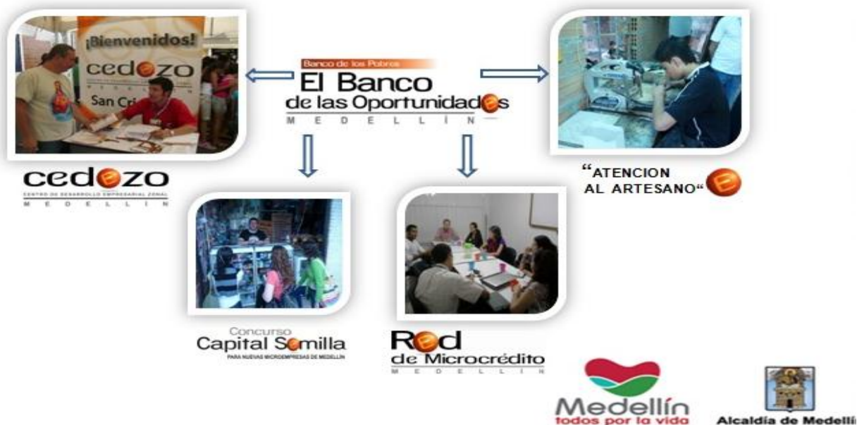
Gráfica No 2: Programas Que Nacen Del Banco De Las Oportunidades. (2014)

Consolidar el programa como una Política Pública Municipal, estableciendo metodologías adecuadas y sistemas financieros alternativos para el desarrollo de la comunidad; financiando proyectos productivos que mejoren los ingresos de las familias emprendedoras de Medellín y sus corregimientos.