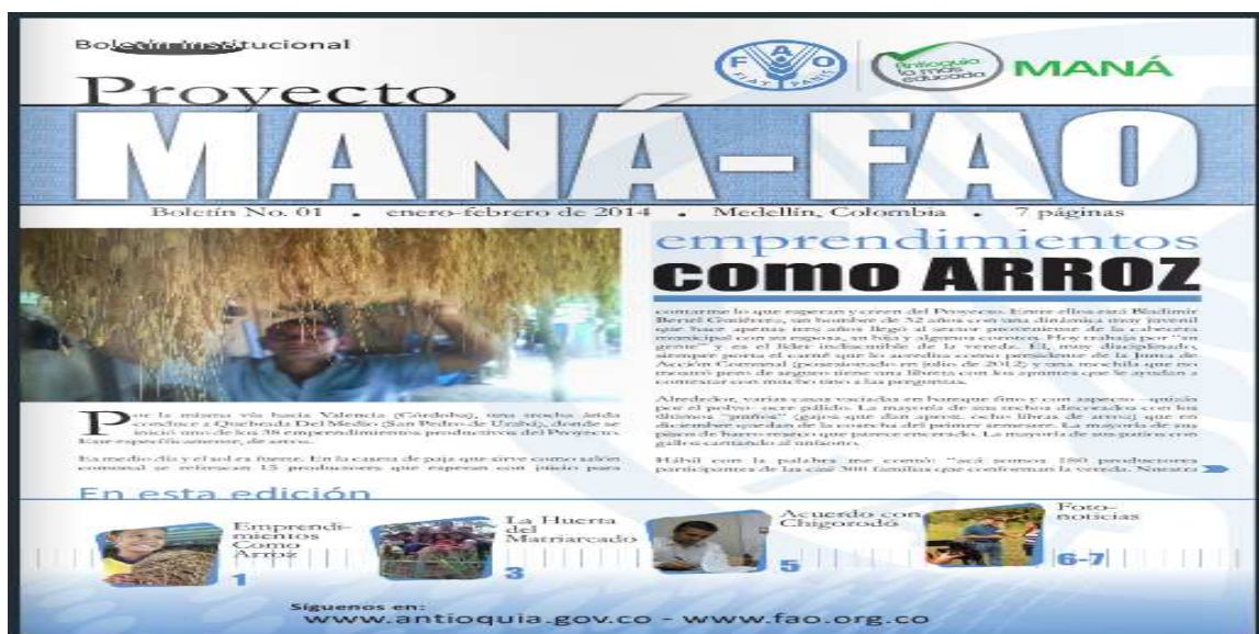
Figura 4.3. Boletín Institucional

A continuación se presentan las gráficas de dos boletines y de un blog creados para difundir la información.