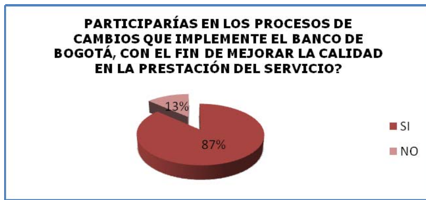
Figura 4. Participarías en los procesos de cambios que implemente el Banco

Los encuestados que en su mayoría corresponden a un 87%, en este caso 28 personas, están dispuestos a participar en los procesos de cambios que implemente el Banco de Bogotá Oficina San Antonio de Prado, con el fin de mejorar la calidad en la prestación del servicio. El otro 13% corresponde a los 2 encuestados que no están dispuestos a ser parte de la propuesta. En este caso, se puede observar que existe un ambiente de disposición al cambio y a la implementación de estrategias, que faciliten la prestación del servicio y el mejoramiento de la calidad de vida de sus empleados.