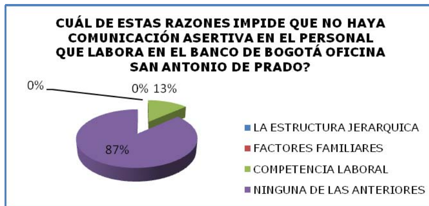
Figura 6. Razones que impiden la comunicación asertiva

De los 30 encuestados el 87% dieron respuesta a la opción “ninguna de las anteriores”, el cual corresponde a 27 personas; y el 13% restante, que fueron 3 encuestados respondió a la opción por competencia laboral. Las otras dos opciones no obtuvieron respuesta.