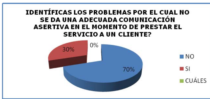
Figura 3. Se identifican los problemas por los cuales no se da una adecuada comunicación asertiva en el momento de prestar el Servicio al cliente

De las personas encuestadas 21 respondieron que No identifican la causa del por qué no se da comunicación asertiva correspondiente a un 70%; y 9 de los encuestados Sí identifican el problema en cuestión, correspondiente al 30%. A la opción de “CUÁLES” problemas identificaban, ninguna de las personas encuestadas dieron respuesta.