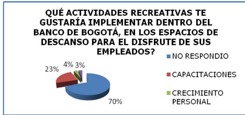
Figura 7. Actividades recreativas que te gustaría se implementaran

La anterior pregunta se dejó de libre opción, para que los encuestados respondieran de acuerdo a sus necesidades. No obstante, se nota con preocupación que un 70% el cual son 21 personas, optaron por no dar respuesta alguna; mientras que un 23% que corresponde a 7 personas consideran que deben de implementar capacitaciones en el personal del Banco; una persona cree que deben realizar charlas de crecimiento personal, y otra plantea que es necesario fomentar apoyo operativo en la atención al cliente.