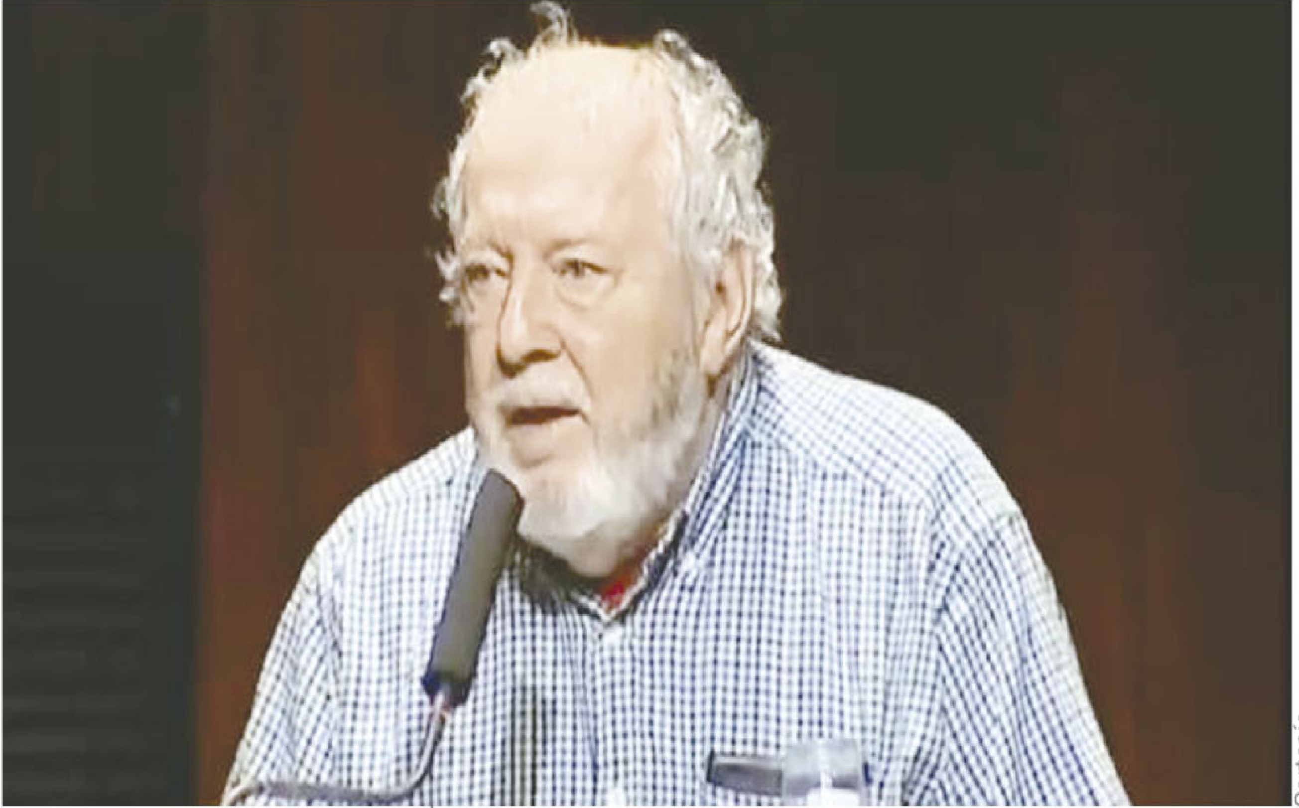
Clément Rosset, filósofo francés.