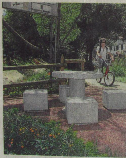
La Picacha genera amenaza por inundación. J. AGUDELO

Por eso las juntas de acción comunal de Las Mercedes, Las Violetas, San Pablo, Altavista y Aguas Frías interpusieron una acción colectiva alegando la "falta de diligencia" y la "omisión" de la Alcaldía de Medellín, Corantioquia y el Área Metropolitana en la ejecución de acciones para