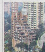
También presentan daños.

MEDELLÍN. A partir de mañana en todos los centros de salud y diferentes puntos de la ciudad habrá jornadas de vacunación gratuita, en el marco de la Semana de Vacunación de las Américas, promovida por la Organización Panamericana de la Salud del 23 de abril al 3 de mayo.