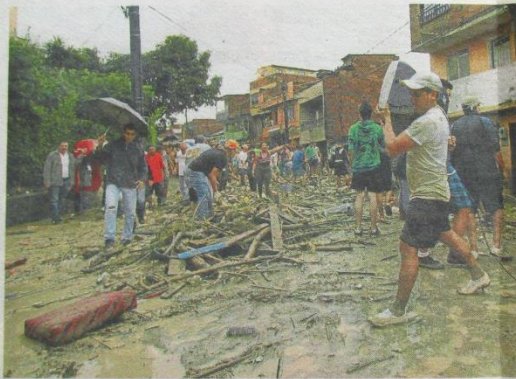
El 18 de diciembre de 2011 la quebrada se desbordó e inundó y destruyó unas 64 viviendas.

Actualmente hay 16 familias en arrendamiento tem-