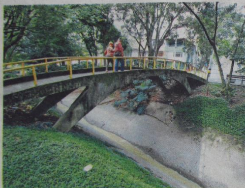
La etapa probatoria podría durar un mes. La comunidad espera que este año quede resuelta la demanda.