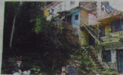
Tras ser profunda la medida, el proceso pasó al Tribunal Administrativo Antioqueño.

En plenaria se analizaron los avances de las obras y los proyectos de inversión para la cuenca de la quebrada.