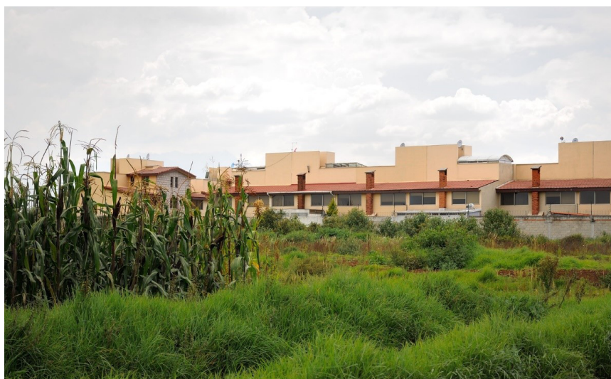
Gráfico 3. Toluca. Municipios periféricos de Toluca sujetos a procesos intensos de suburbanización